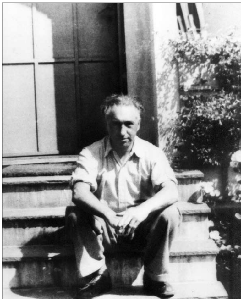
Wilhelm Reich in Oslo, 1935