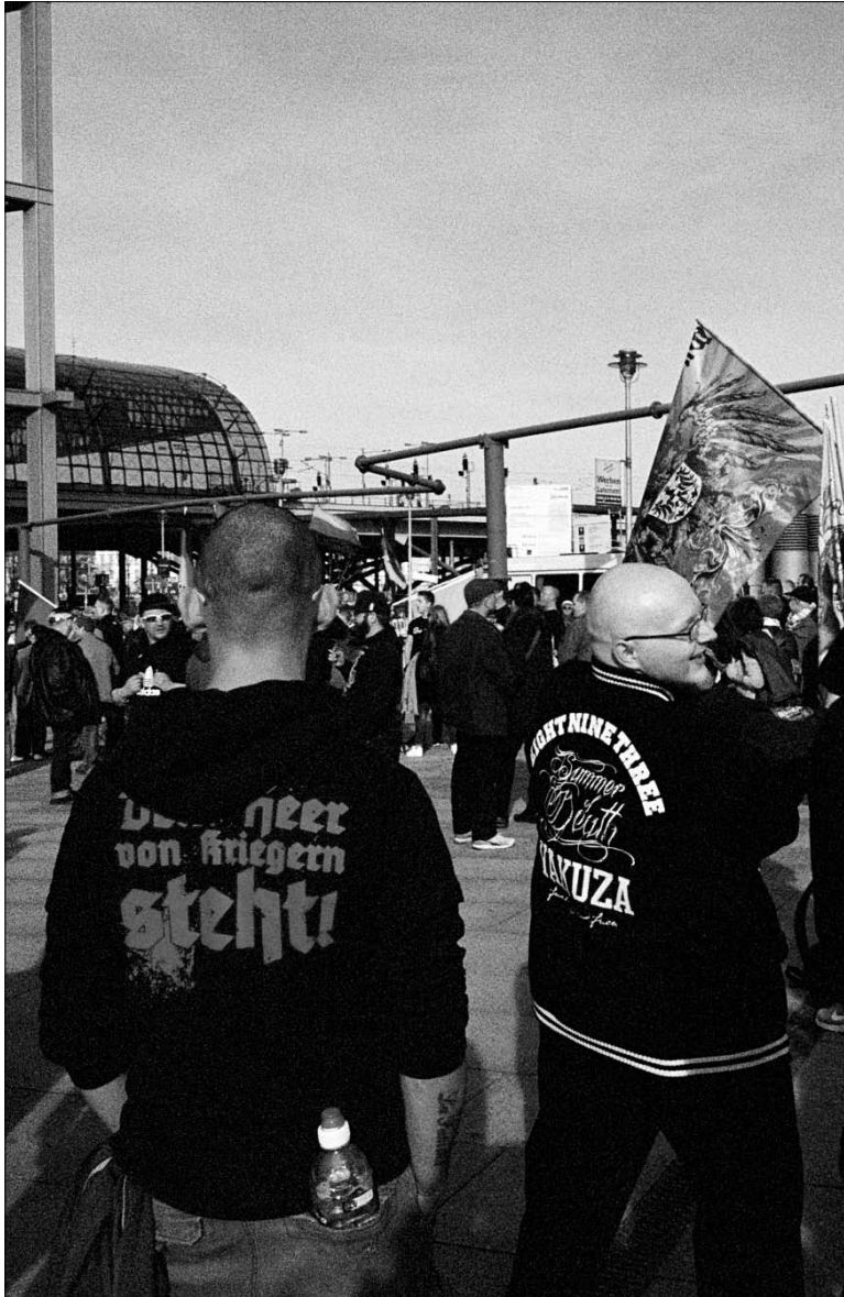
Bärgida-Kundgebung am Berliner Hauptbahnhof, 2017